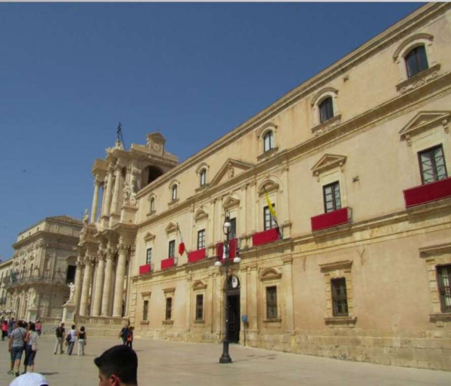
Duomo di Siracusa